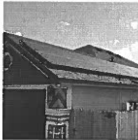
Casa con paneles solares en McAllen