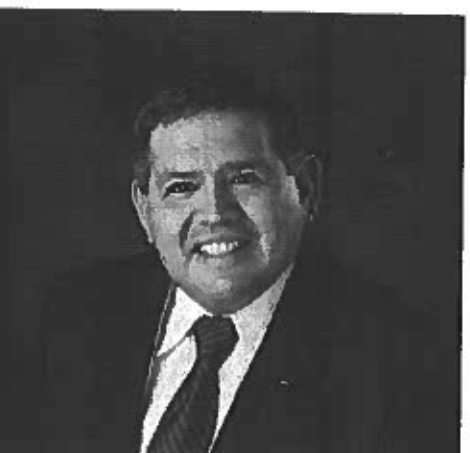
Joaquin "J.J." Zamora

Mayor-Pro-Tem / Commissioner - District 2