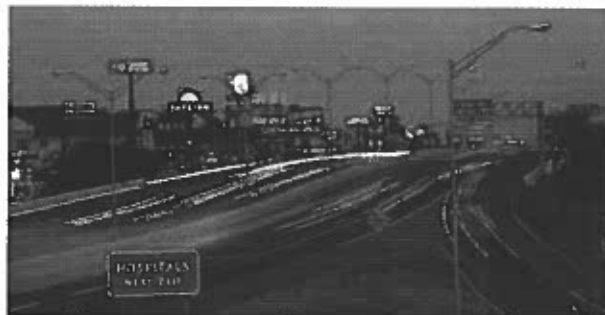
Infraestructura urbana con excelente equipamiento

lo se menciona que existe gran flujo de automóviles en la frontera McAllen-Reynosa