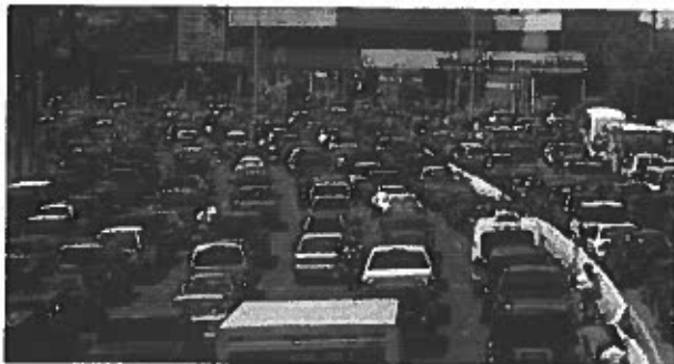
Visitantes en McAllen

Esto ha provocado que su desarrollo sea de los mejores a nivel estatal y nacional. McAllen tiene la política de crear menos muros y más puentes.