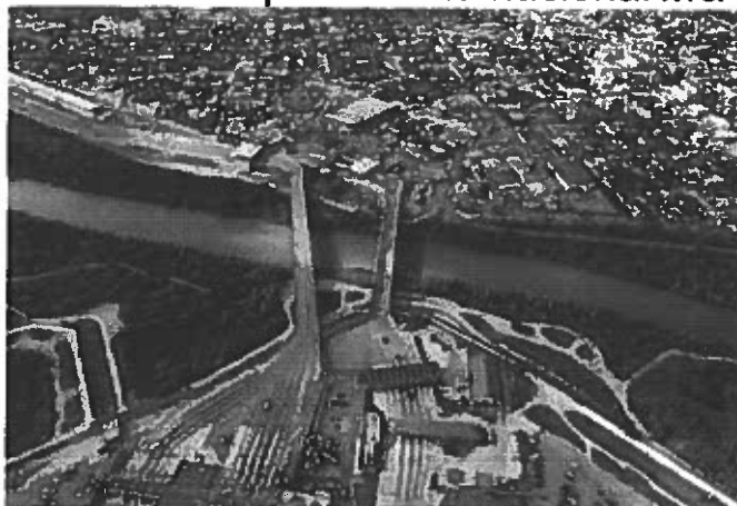
Puente internacional McAllen - Reynosa

En 2014 la industria maquiladora del sur de Texas hizo promoción e inversión en Reynosa Tamaulipas de medio millón de dólares, lo que provocó más ampliaciones en naves industriales así como crecimiento en industria automotriz y electrónica y el mejoramiento del puente internacional McAllen-Hidalgo-Reynosa